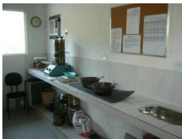
Laboratório próprio de análises