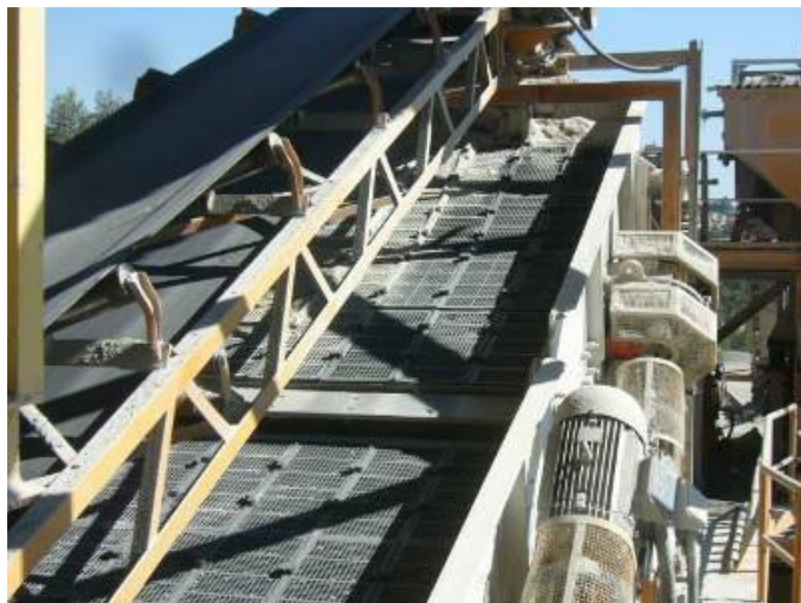
Peneira para classificação de materiais finos