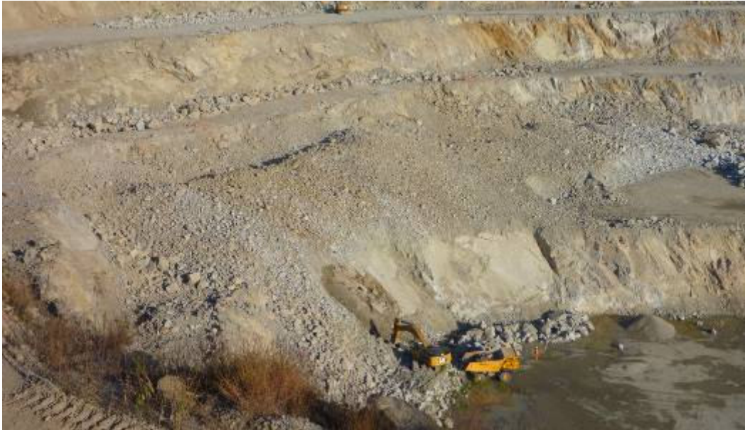
Material fragmentado da detonação.